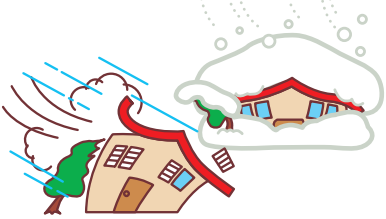
台風や大雪による被害