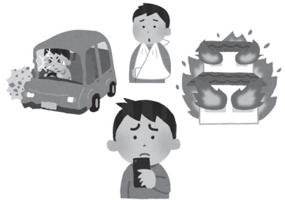
事故が発生したらすぐに連絡することが大切です。